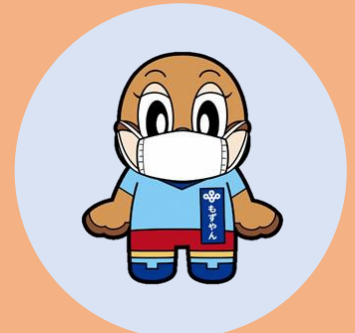
有症状時の マスクの着用を含む 咳エチケット