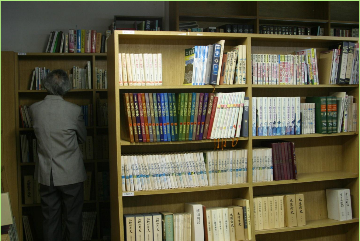
歴史関係の図書室。歴史本、民話、郷土史などの本を閲覧できます。