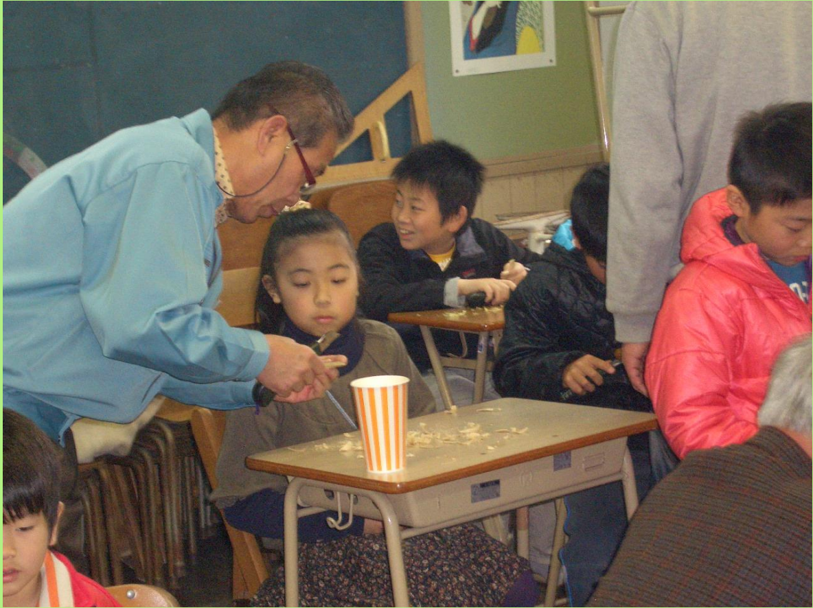
青少年指導員の協力による竹とんぼ体験 実は、大人の方が盛り上がっている。