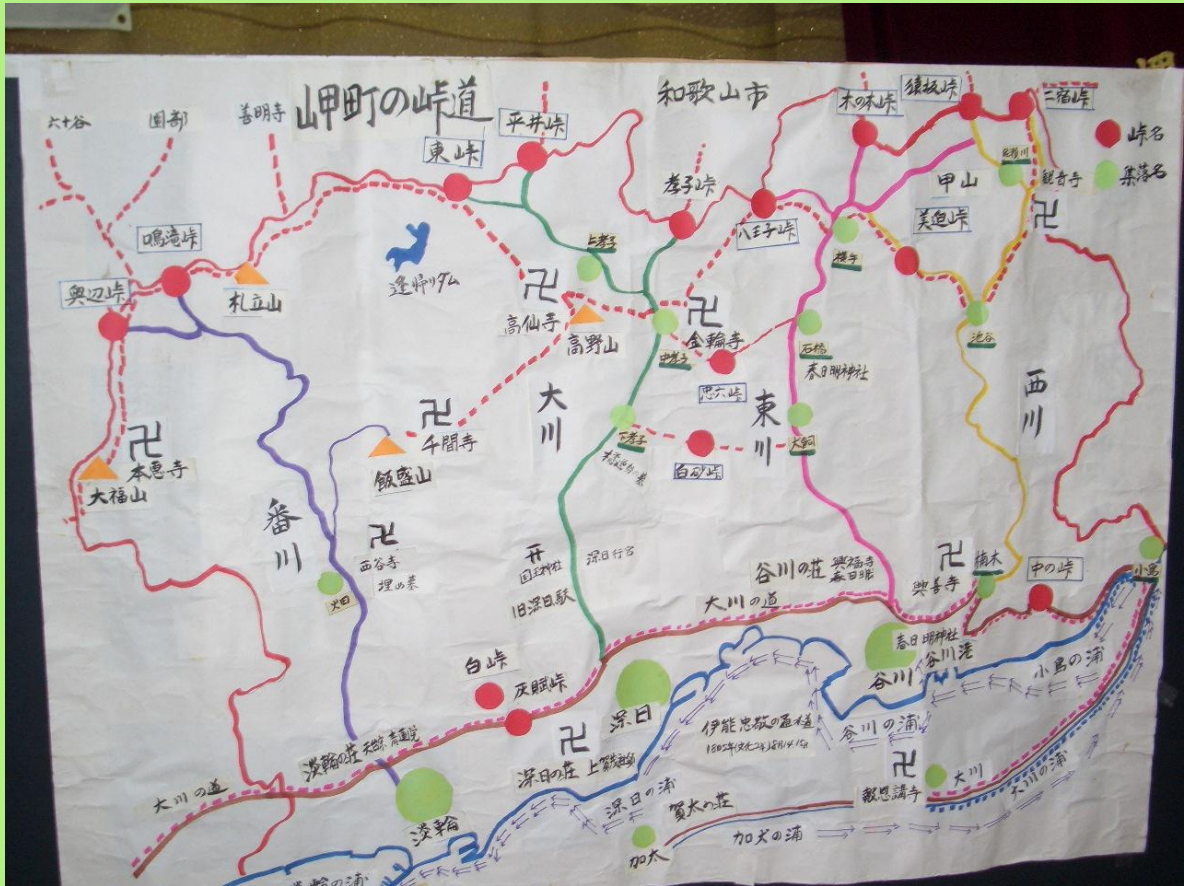
岬の峠道の図面・・・ 現在も歴史館に飾ってます。