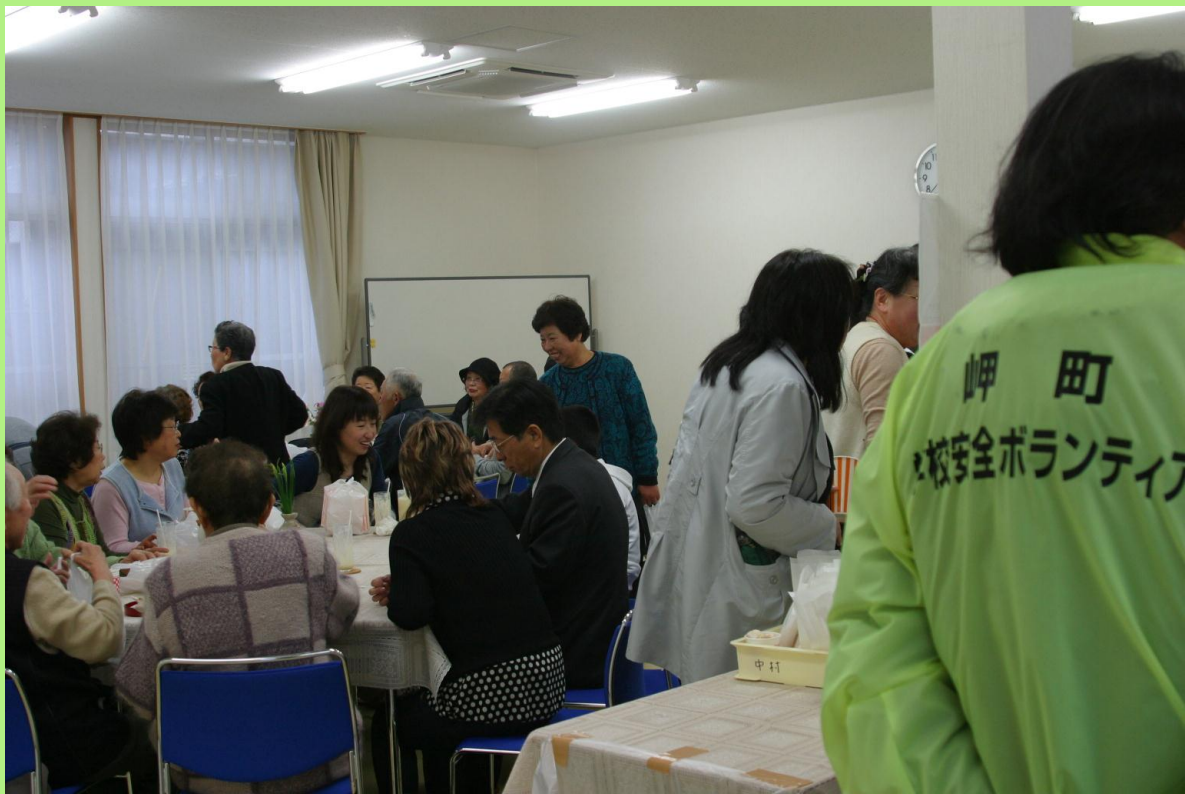
孝子地区の方々の協力による喫茶コーナー