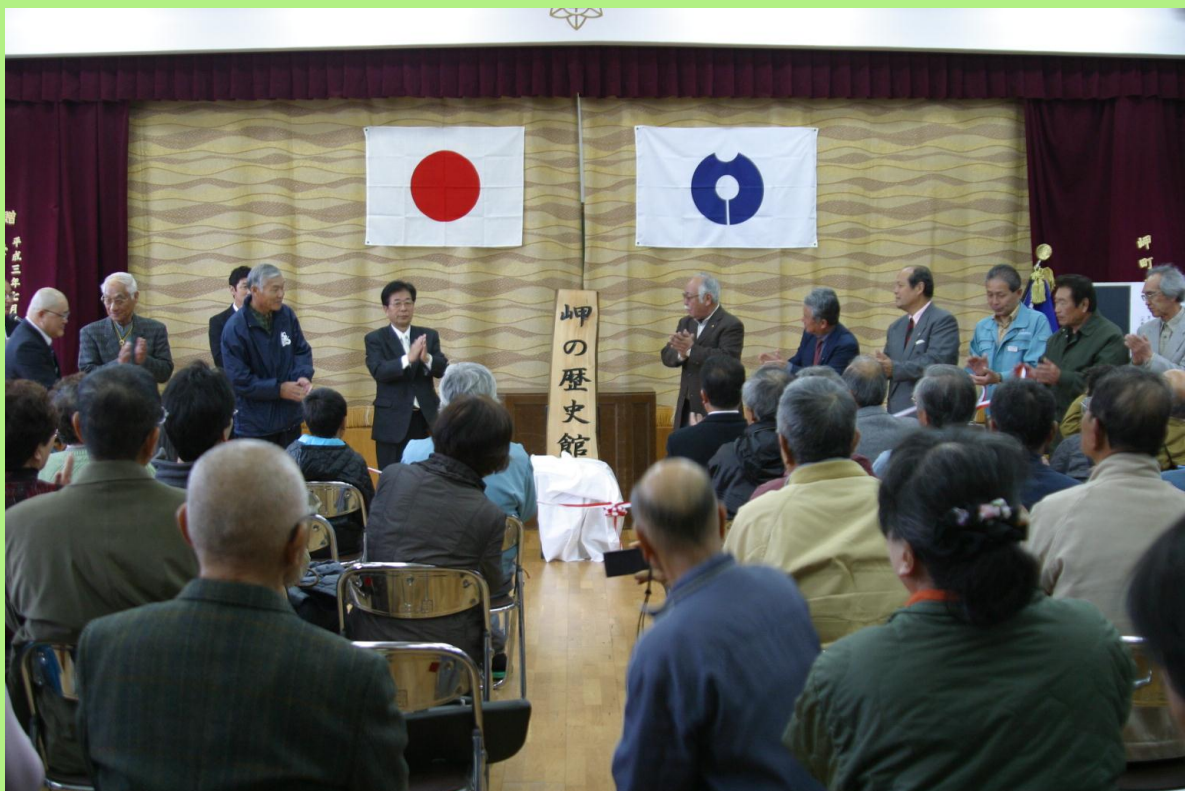
関係者の皆様による看板除幕式（看板文字 田代町長）