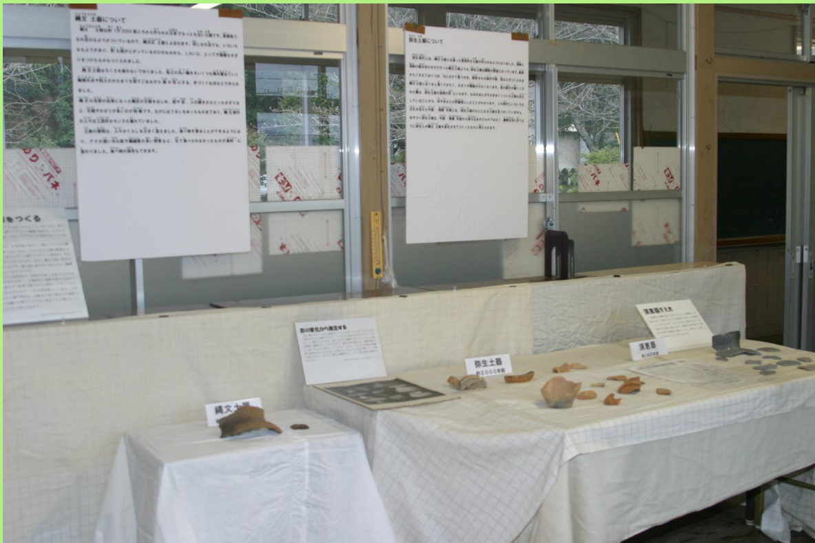
岬町内の発掘調査で出土した土器や石器等。 中には、勾玉（まがたま）や埴輪も・・・