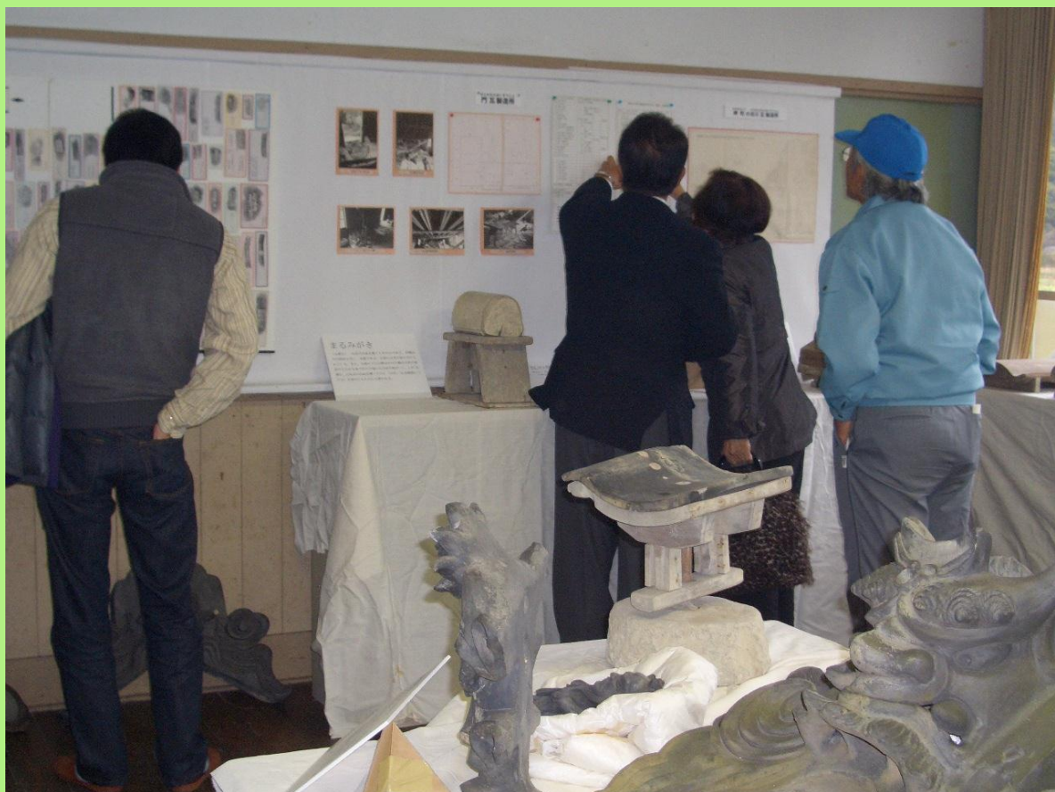
谷川瓦展示室では町内で瓦をつかった記録や、珍しい鬼瓦などを見ることができます。