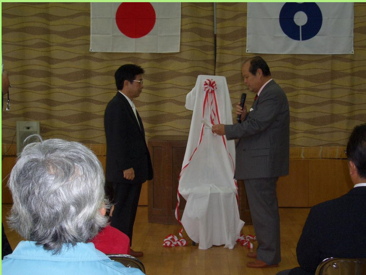
ライオンズクラブから歴史館に空調機器及びパソコン関係機器の寄贈