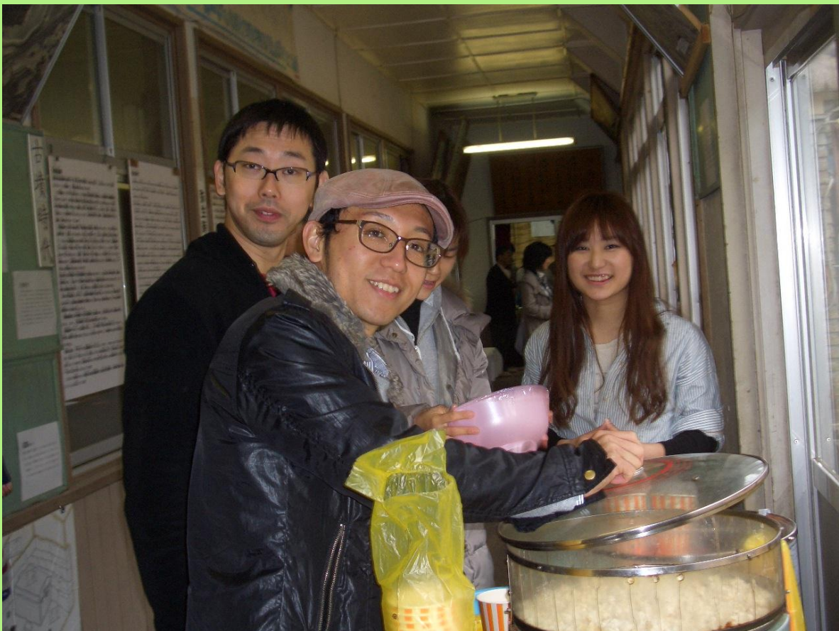
ボランティアの方々による模擬店

この機会を利用して模擬店や体験教室を開催し、孝子地区住民とボランティア関係者並びに地域の親子ふれあいの場としての繋がりや交流を深めることができました。