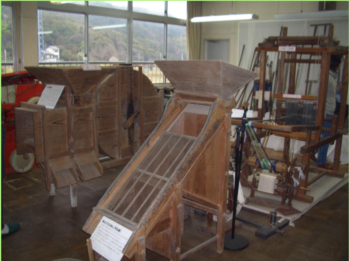
歴史館では、地元の方々から寄贈された、古い農機具を展示しています。