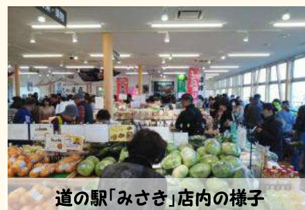
道の駅「みさき」店内の様子