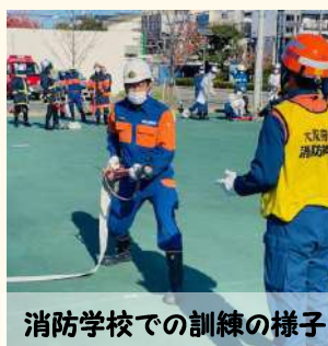
消防学校での訓練の様子