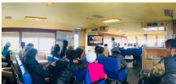
運航期間 R3.10.23~11.28 (土日祝)