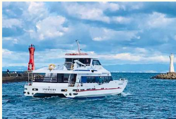
深日洲本ライナー「インフィニティ」

(回答)岬町、洲本市ともに航路は維持したい意向だが、国からの補助金がなければ運航が難しいことから、今後要望活動を進める。