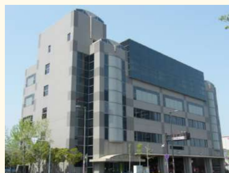
泉州南消防本部(泉佐野市)