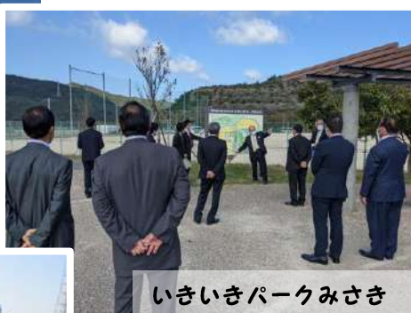
いきいきパークみさき

「美咲町には海がないので、海があって素晴らしい景色だ!」と感動しておられました。