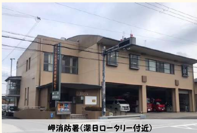
岬消防署(深日ロータリー付近)