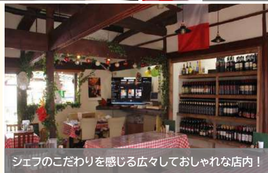
シェフのこだわりを感じる広々しておしゃれな店内!