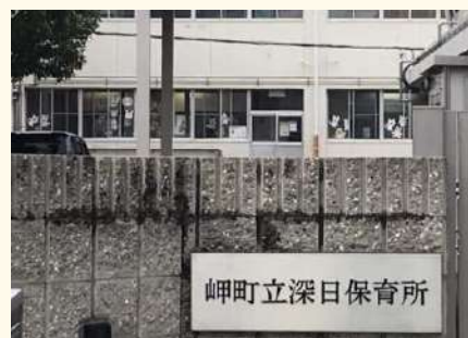
岬町立深日保育所

(回答)指定管理料は来年度予算に計上中なので記載を控えているが、事業者からの提案は633万円。