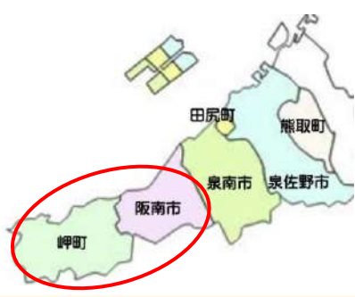
岬町と阪南市で運営