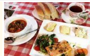
ノルウェーサーモンのグリル