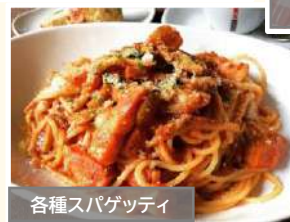
各種スパゲッティ