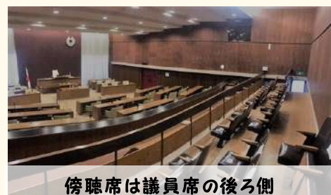
傍聴席は議員席の後ろ側

町議会はどなたでも傍聴できます。役場3階議会事務局で住所・氏名・年齢を受付票に記入してください。本会議場の定員は32名ですが、現在はコロナ感染対策のため16名になっています。