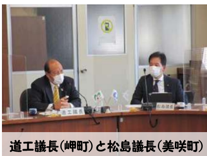
道工議長(岬町)と松島議長(美咲町)

お互いの町が抱える様々な分野での課題や取り組み、今後より友好関係を深める為の交流活動について意見交換を行いました。