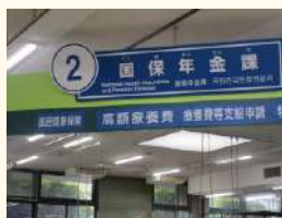
(泉佐野市役所の様子) 各窓口がわかりやすく表示されている。