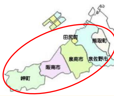
3つの「市」と3つの「町」で構成