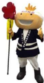
泉州南消防組合 マスコットキャラクター 消し玉くん

岬町は阪南市と消防組合として、各市町は単独で消防本部を持って活動していたが、H25.4.1、泉佐野市消防本部・泉南市消防本部・熊取町消防本部・阪南岬消防組合を統合して泉州南消防組合が設立された。