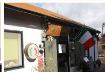
高台の古民家を改装したお店