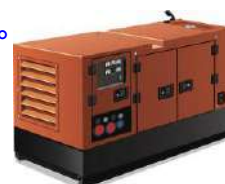
発電機のイメージ図

(質問) 人体炉3炉と動物炉1炉あるが、現在人体炉は2炉しか使用できていない。なぜか？