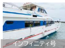
インフィニティ号

(回答)令和元年の実績をもとに、台風やコロナの影響による減少を考慮し目標を設定。おおむね達成できた。