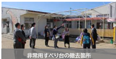
非常用すべり台の撤去箇所

老朽化した非常用すべり台の撤去、給食昇降機の修理、トイレ改修の現地を確認しました。これからも保育環境の充実に取り組んでいきます。