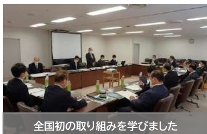
全国初の取り組みを学びました

現地の店舗などその場で寄附して、そのまま返礼品を受け取ることができる「店舗型ふるさと納税」。飲食店への導入は全国初。「地域ポイント」は地元店舗での買い物や公共施設利用などでポイントが貯まる仕組みで、地域活性化に活かされていた。