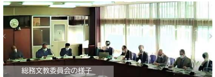
総務文教委員会の様子