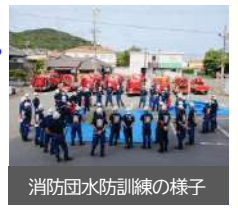
消防団水防訓練の様子

史上最強クラスの台風だったが、大きな被害も無く無事に乗り越えた。引き続きたゆまぬ努力をお願いします。