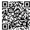
令和4年度議事録一覧