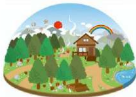
ドーム型施設のイメージ図

(回答) 募集要項に、資機材・消耗品等の調達、人材の雇用は町内で確保するとあり、十分配慮するよう求めていく。