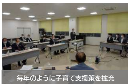
毎年のように子育て支援策を拡充

町をあげて子育て支援に力を入れ、どこよりも先駆けて取り組んでいた。若い世代の移住・定住につながり、人口増加や高い出生率を実現。デマンドタクシーは目的に合わせて、運行地域、ルート、利用条件・方法などを決定し、他の公共交通との共存を実現。