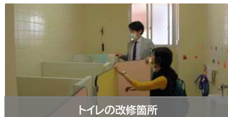
トイレの改修箇所