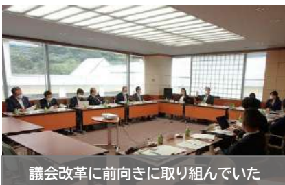
議会改革に前向きに取り組んでいた

「議会のあり方検討委員会」を設け、10年以上取り組んでこられた議会改革について学びました。住民と気軽に意見交換ができる「おしゃべりカフェ」など、すぐにでも取り入れられるものは積極的に検討していきたいと思います。