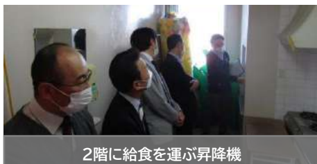
2階に給食を運ぶ昇降機