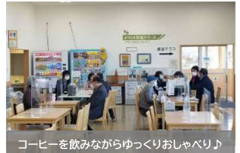
コーヒーを飲みながらゆっくりおしゃべり♪