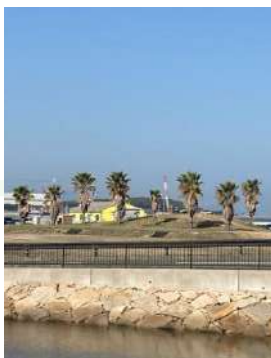
大阪府が管理する 深日漁港ふれあい広場