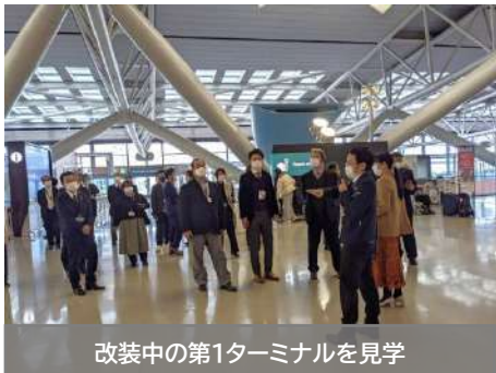
改装中の第1ターミナルを見学

「大阪府南部地区町村議長会」主催の議員セミナーに参加。国際線利用者の増加に対応するための第1ターミナル大規模改装計画の報告を受け、現地を見学しました。