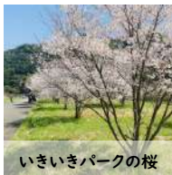
いきいきパークの桜

(回答)立派な花を咲かせている木がたくさんある。『岬だより』でも取り上げている。