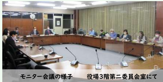
モニター会議の様子 役場3階第二委員会室にて