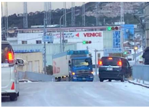
町内あちこちで車が立ち往生して交通渋滞が発生

(回答) 職員や消防団の活動ができるよう、大雪への対処に限らず、車両の装備面から防災の体制づくりに努めていく。