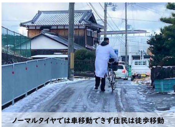
ノーマルタイヤでは車移動できず住民は徒歩移動