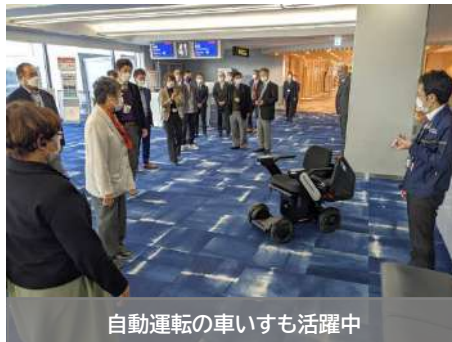
自動運転の車いすも活躍中