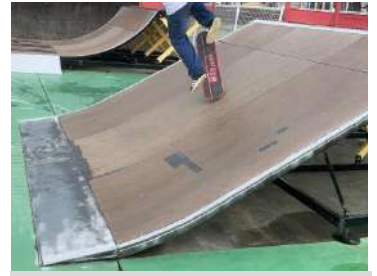
スケボーパークのセクションイメージ