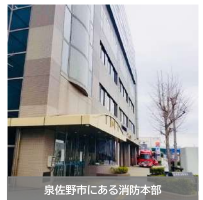
泉佐野市にある消防本部

また、エネルギー高騰による電気代・燃料代の補正予算や令和5年度予算を審議し、ドローンの導入、岬署の救急車の更新が決定しました。