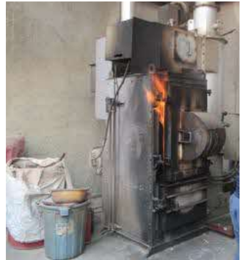
(基準を満たした焼却炉であっても) 劣化等で炉が密閉できていない