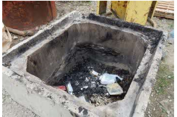
弁当がらなどの焼却