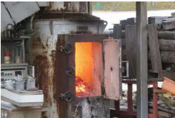
(基準を満たした焼却炉であっても) 炉を開けたまま焼却