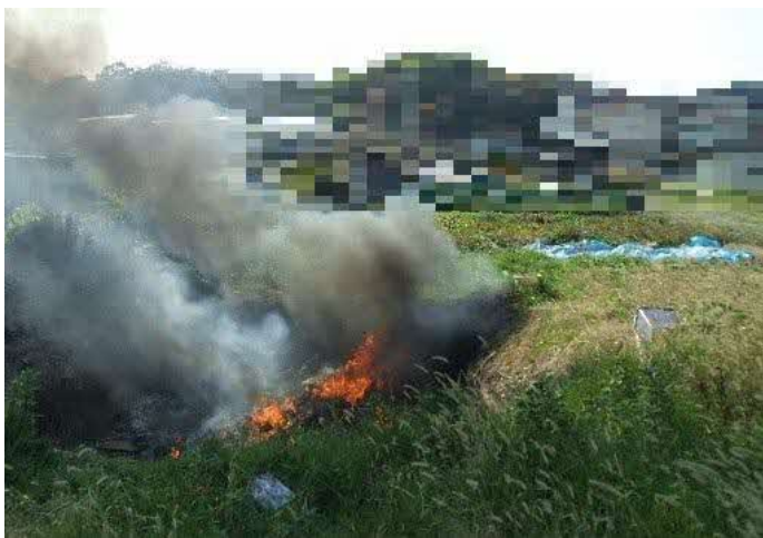
農業用ビニールシートなどを野焼き