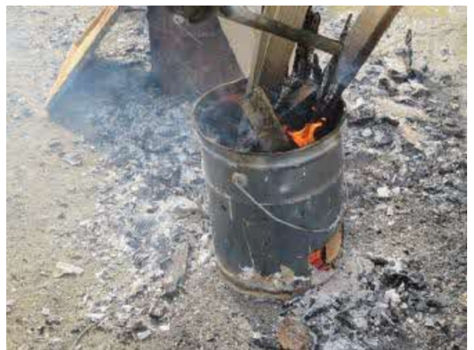
木くずなど廃棄物の焼却による暖取り