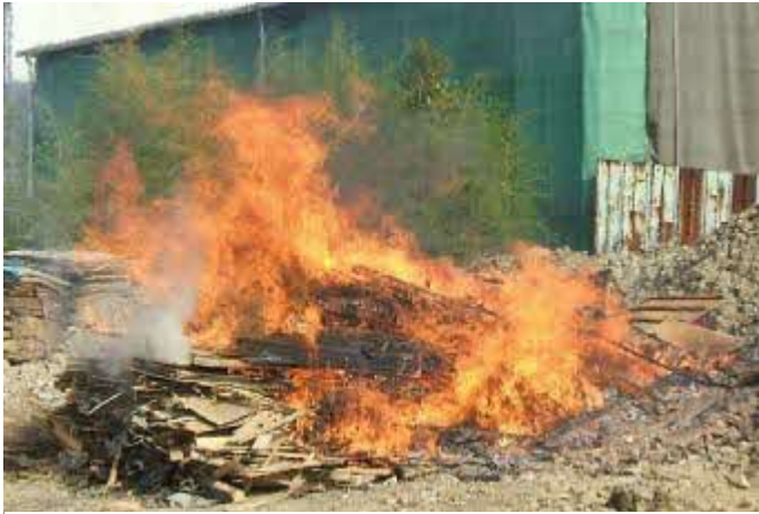
あからさまな野焼き