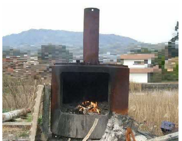
基準を満たさない焼却炉で焼却