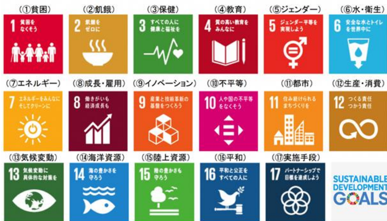
ロゴ：国連広報センター作成

岬町においては、地域の課題に対し、産官学をはじめとする多様なステークホルダーとの連携を図り、持続可能な地域づくりを進めることとしており、SDGs の理念に沿った様々な取り組みを通して、地方創生の推進と地域の活性化を目指していく必要があります。