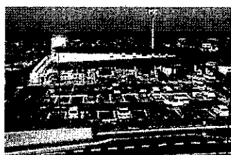
道の駅 みさき 夢灯台