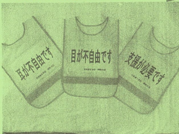
災害避難時に着用し避難します