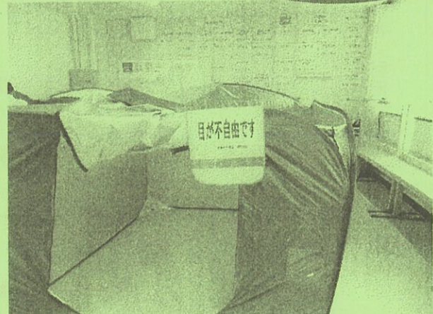
避難所のテントに吊下げ「支援が必要」であることを知らせます

○問合せ 岬町役場しあわせ創造部福祉課福祉係 Tel 492-2700 Fax 492-5814