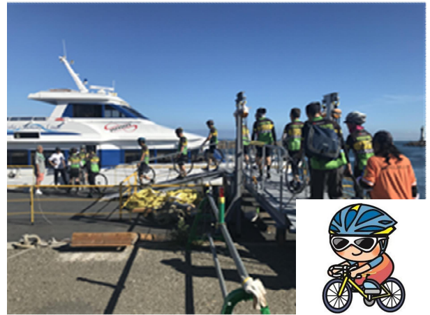
【深日洲本ライナー】

緑に囲まれながら、軟式野球、ソフトボール、サッカーやラグビーをプレーできる「いきいきパーク」などをはじめ、幅広い年代の方々が交流できるよう取り組んでいます。