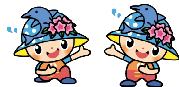
岬町マスコットキャラクター みさっきー&みさきーちよ