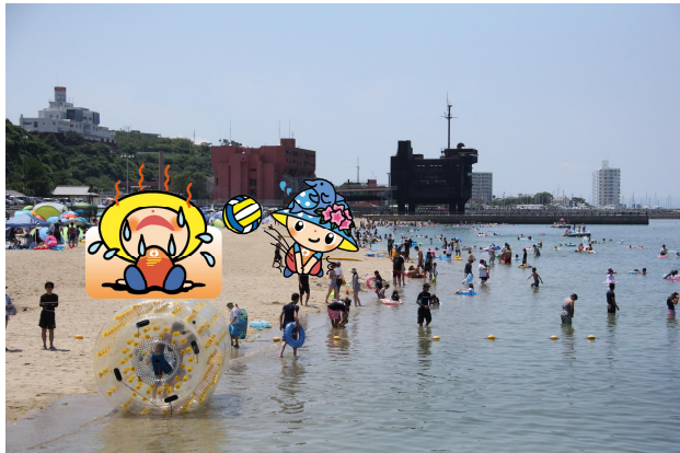
【ときめきビーチ（淡輪海水浴場）】

多種多様なビーチスポーツが楽しめる 海水浴場、ヨットやカヌーの体験など マリンスポーツも楽しめる海があります！