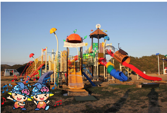
【みさっきー実りのツリーハウス】