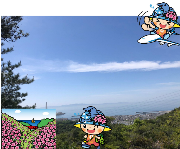
【町内から眺める景色】

陽春の頃は桜色、初夏から秋にかけては新 緑、秋は朱色と年間を通じ、色鮮やかな景色 を楽しむことができます。