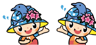
岬町マスコットキャラクター