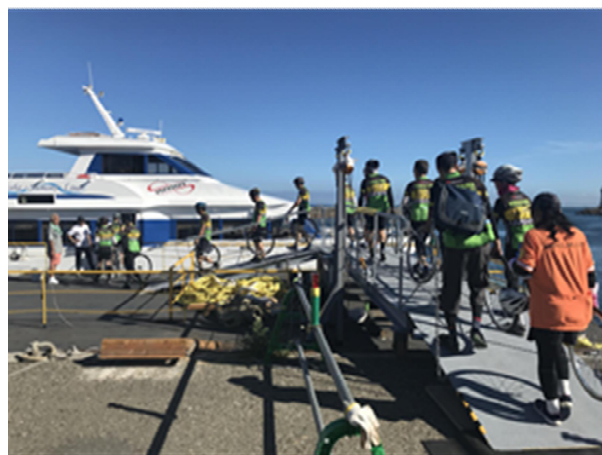
【深日洲本ライナー】