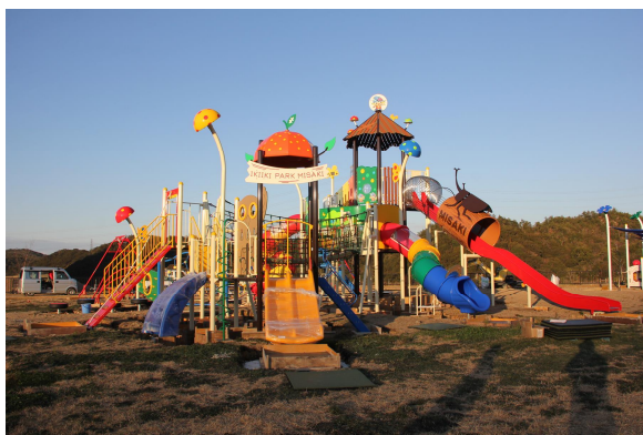
【みさっきー実りのツリーハウス】