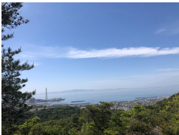
【町内から眺める景色】

陽春の頃は桜色、初夏から秋にかけては新 緑、秋は朱色と年間を通じ、色鮮やかな景色 を楽しむことができます。