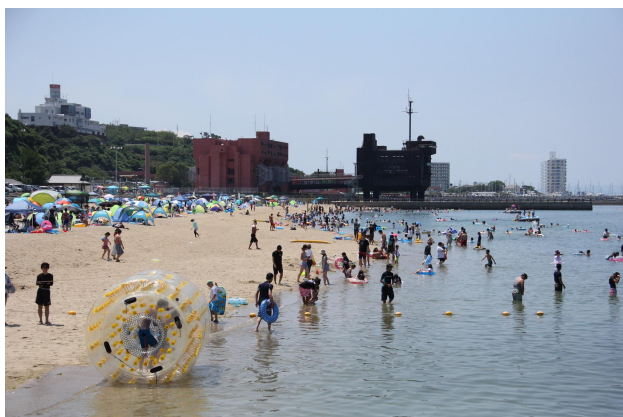
【ときめきビーチ（淡輪海水浴場）】

多種多様なビーチスポーツが楽しめる 海水浴場、ヨットやカヌーの体験など マリンスポーツも楽しめる海があります！