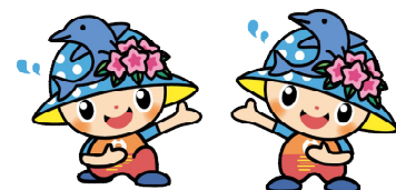
岬町マスコットキャラクター みさっきー&みさきーちょ