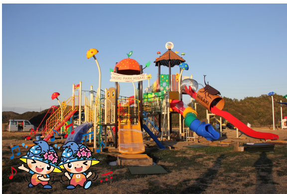
【みさっきー実りのツリーハウス】