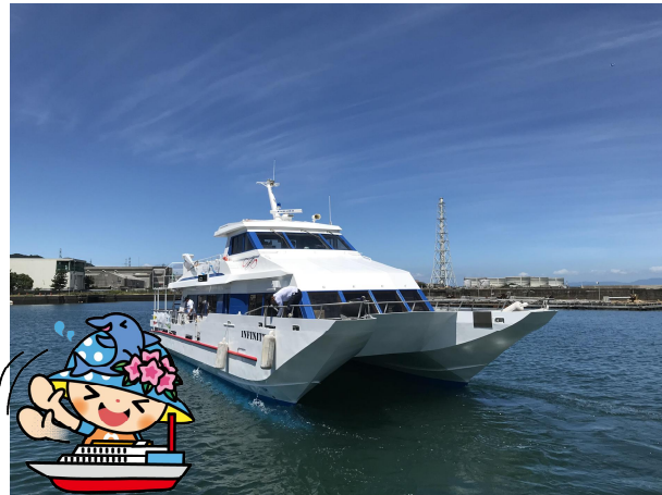
【深日洲本ライナー】

本町では、近年、注目を集めている観光とサイクリングを組み合わせた『サイクル・ツーリズム』に着目し、「泉州サイクルルート」や「アワイチ」などのサイクルルート大阪湾上を通じて結び、サイクリストの利用による、さらなる需要拡大を目指して、事業展開を行っています。