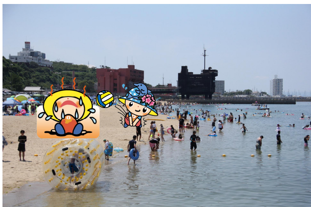
【ときめきビーチ（淡輪海水浴場）】

多種多様なビーチスポーツが楽しめる 海水浴場、ヨットやカヌーの体験など マリンスポーツも楽しめる海があります！