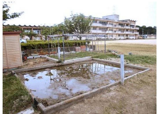
【田植えを待つ稲作の学習園】

民生児童委員さんのご厚意で、乳幼児の一時保育ができます。また、ふれあいルームで、喫茶『めだか組』も開催しておりますので、どうぞご利用ください。