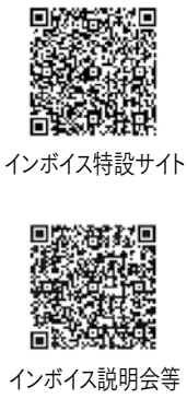
インボイス特設サイト