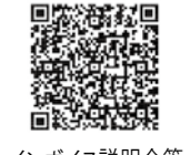
インボイス説明会等