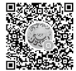
LINEオープンチャット