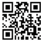
確定申告書作成コーナー

申告書は国税庁ホームページで作成し、e-Tax送信していただくか、郵送で提出ください。