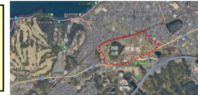
農業公園整備事業