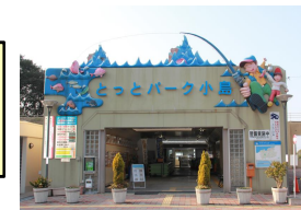
とっとパーク小島