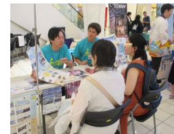
移住・定住フェア