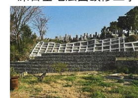
深日墓地法面改修工事