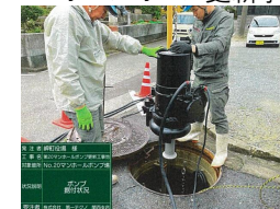
マンホールポンプ更新事業