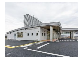
泉州南部初期急病センター