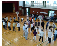
岬町長生会イベント