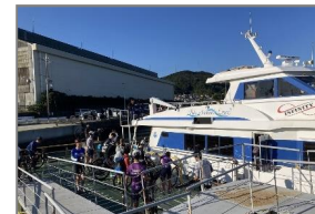
深日・洲本ライナー