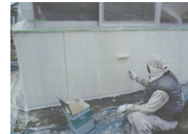
保育所雨漏り修繕