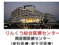
泉州広域母子医療センター