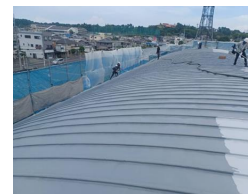
深日小学校体育館屋根改修工事