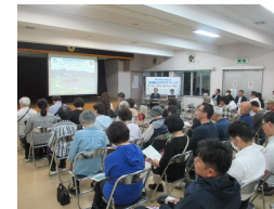
タウンミーティング