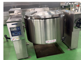
給食センター整備事業