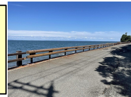
町道岬海岸番川線整備事業 橋りょう整備事業