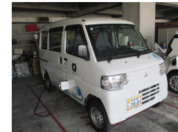
電気自動車(公用車)