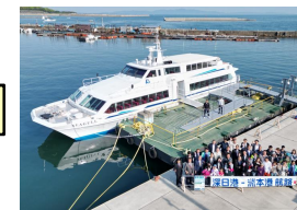
深日・洲本ライナー