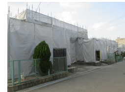
町営多奈川平野北住宅 長寿命化改修工事