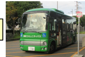
コミュニティバス運行事業