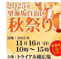
自治区の秋まつり