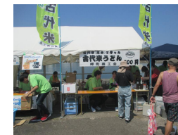
深日港活性化イベント