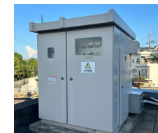
保健センター整備事業