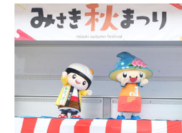
友好交流推進事業