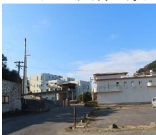
ごみ処理施設・し尿処理施設