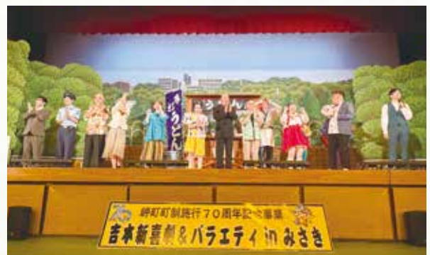
70周年記念イベントの様子