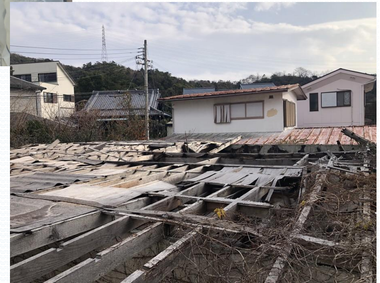
屋根下地材等の部材が飛散

┆ (別途) 同時並行 ┆ 行政にて ┆ 当該物件の ┆ 売買を模索 ┆ [不動産会社等と協議] ┆ ↓