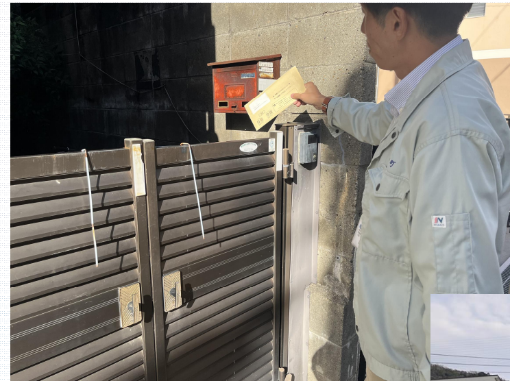
所有者宅（兵庫県）を訪問