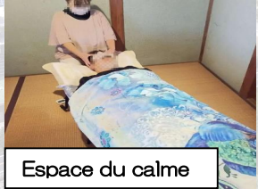
Espace du calme