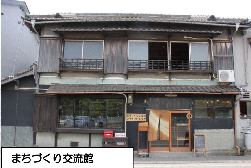
まちづくり交流館