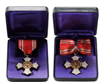
▲金色有功章個人 ※法人は橋式

※上記の表彰のほか、その金額に応じて国の表彰申請の手続きをしております。詳細は支部までお問い合わせください。