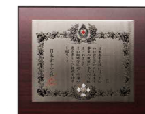
▲銀色有功章(個人・法人橋式)