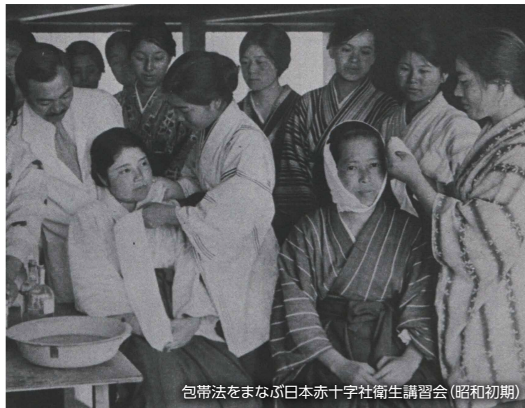
包帯法をまなぶ日本赤十字社衛生講習会(昭和初期)

日本赤十字社は、1926年から現在の「救急法」の前身である「衛生講習会」を事業に取り入れ、衛生学、救急法、家庭での看護の方法などの普及を開始しました。