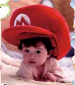
R7. 4. 10生まれ 深日 井上 巳愛ちゃん