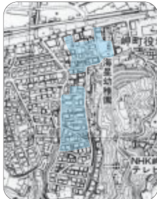
▼深日 緑1・緑4の一部